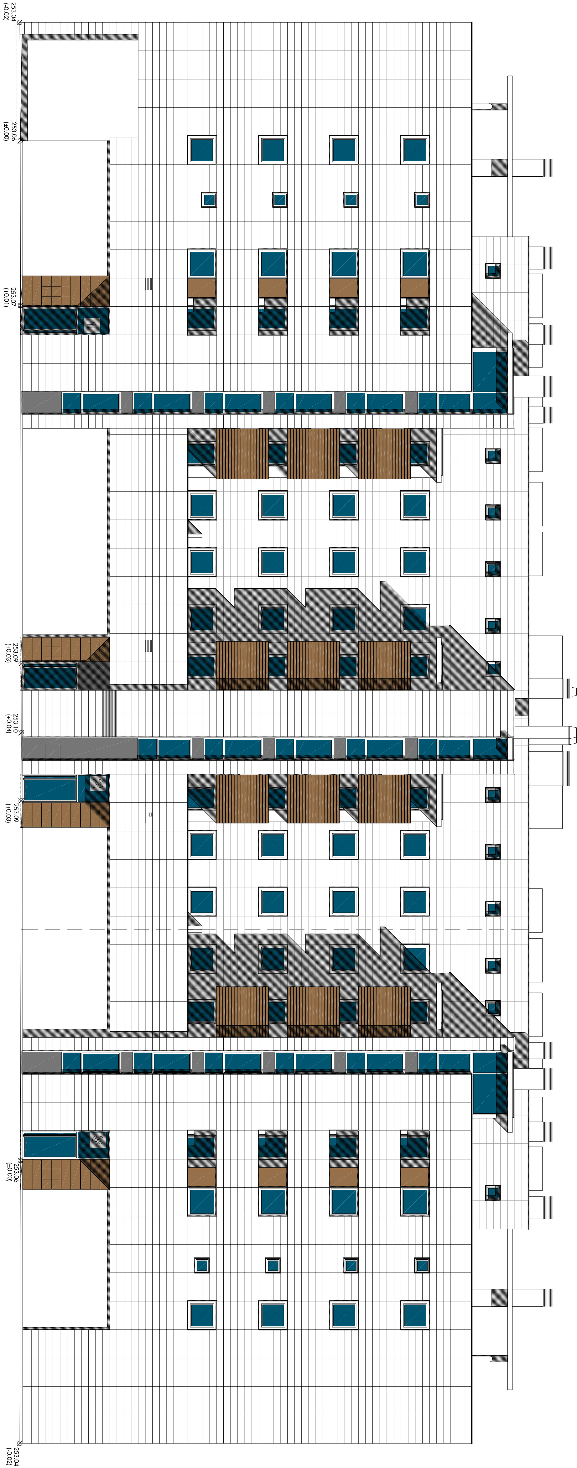
ALZADO NORTE - N